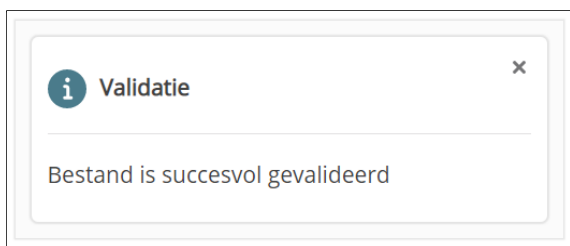
Figuur 4: Bij een geslaagde validatie zal bovenstaande melding worden getoond.

Na het uploaden is het valideren van de gegevens de volgende stap. Uit welke onderdelen de validatie bestaat, is terug te vinden in de aanleverinstructie. Indien de validatie niet slaagt, zal het bestand niet in het REV worden gepubliceerd.