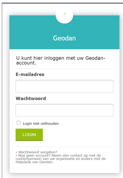
Figuur 1: Inlogvenster voor het REV portaal.