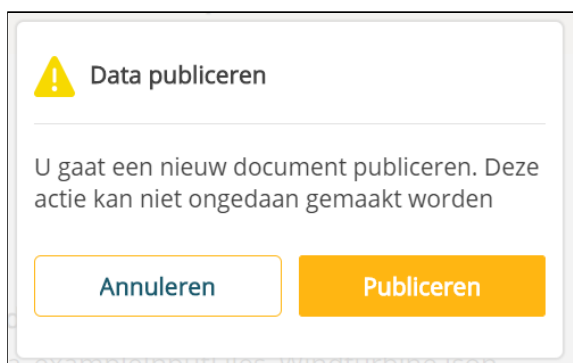
Figuur 7: Aanleveren van nieuwe data.

Na een geslaagde validatie kunnen de gegevens in het REV worden geplaatst. Wanneer de gegevens nog niet in het REV bestaan, zal hiervan melding worden gemaakt.