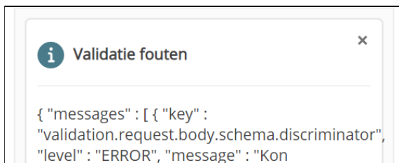
Figuur 5: Bij een mislukte validatie zal hierover informatie worden getoond.