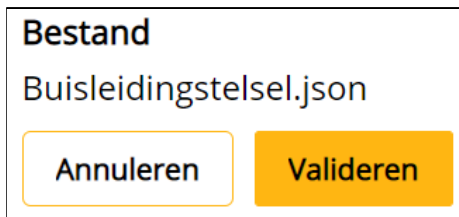
Figuur 3: Het valideren begint door op de getoonde knop te drukken.

Na het uploaden is het valideren van de gegevens de volgende stap. Uit welke onderdelen de validatie bestaat, is terug te vinden in de aanleverinstructie. Indien de validatie niet slaagt, zal het bestand niet in het REV worden gepubliceerd.